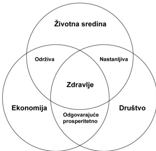
Slika 1. Zdrava, održiva zajednica [1]

U mnogim aspektima, zdravlje stanovništva nije prirodni proizvod, već je rezultat interakcije i ravnoteže između društva, ekonomije i pritiska na životnu sredinu kao i pokretačkih snaga razvoja.